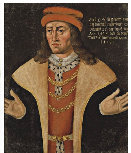
Erik av Pommern. Nationalmuseum.