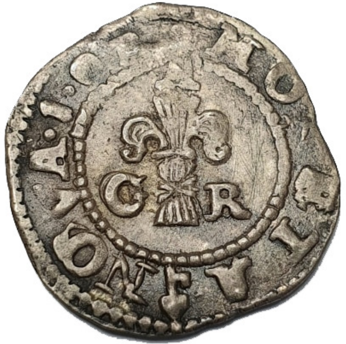
Gustav II Adolf 1 öre 1624.