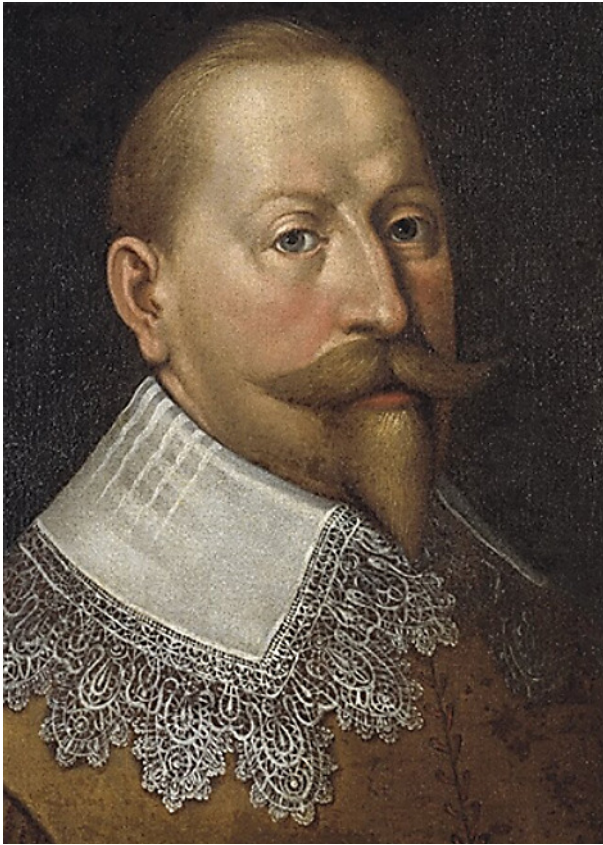
Gustav II Adolf. Konstnär okänd. Målningen hänger i Furstinnan Marias sängkammare på Gripsholms slott och ingår i Svenska statens porträttsamling.