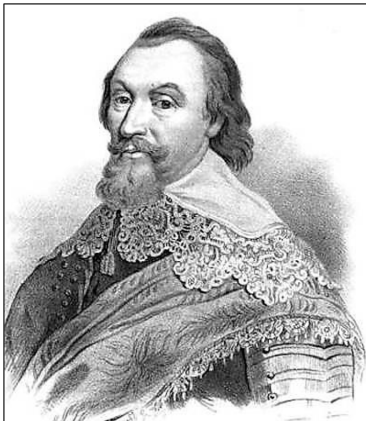
Rikskanslern Axel Oxenstierna.

Tullkammaren förestods av en tullförvaltare, och under honom verkade tullnärer, uppsyningsmän och skrivare. Tullkamrarna sorterade under generaltullförvaltaren, senare överdirektören, i Stockholm.