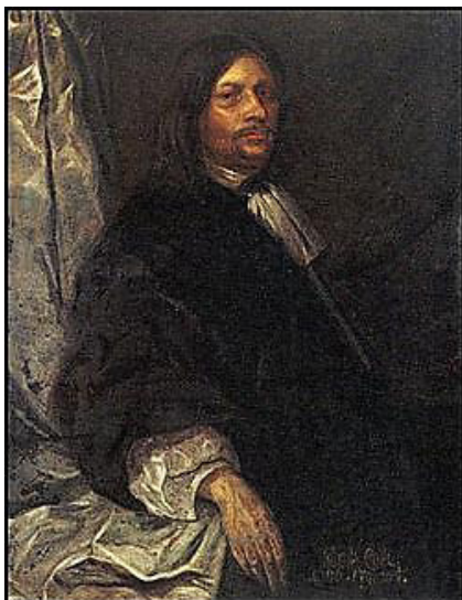
Gustaf Otto Stenbock, född 7 september 1614 i Torpa stenhus i Västergötland, död 24 september 1685 i Stockholm, var en svensk greve, militär och ämbetsman.

Ett arbetslag med män rekryterade från allmogen i trakten. Ett försök att såga upp isen kring skeppen för att få det till öppet vatten.