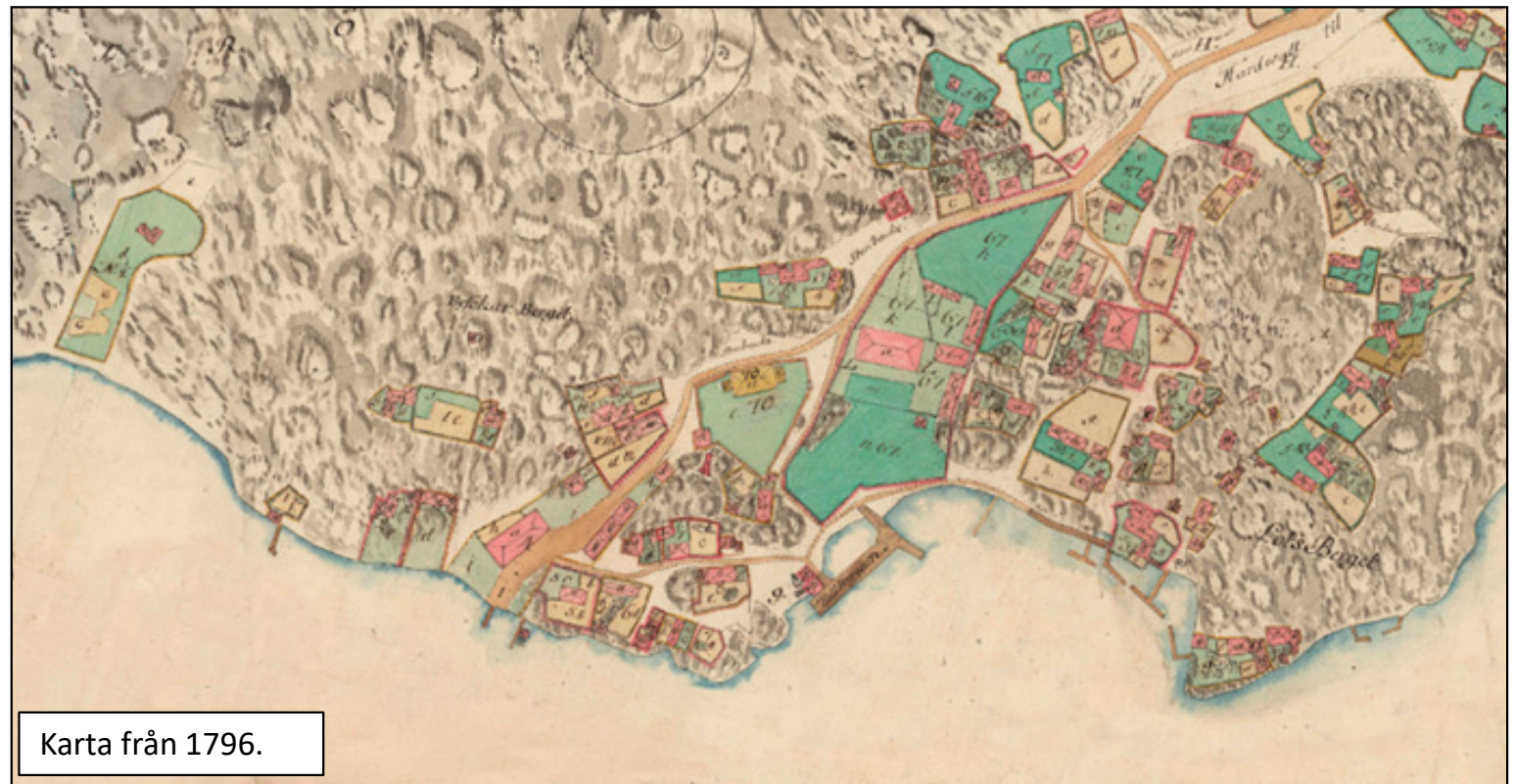
Karta från 1796.