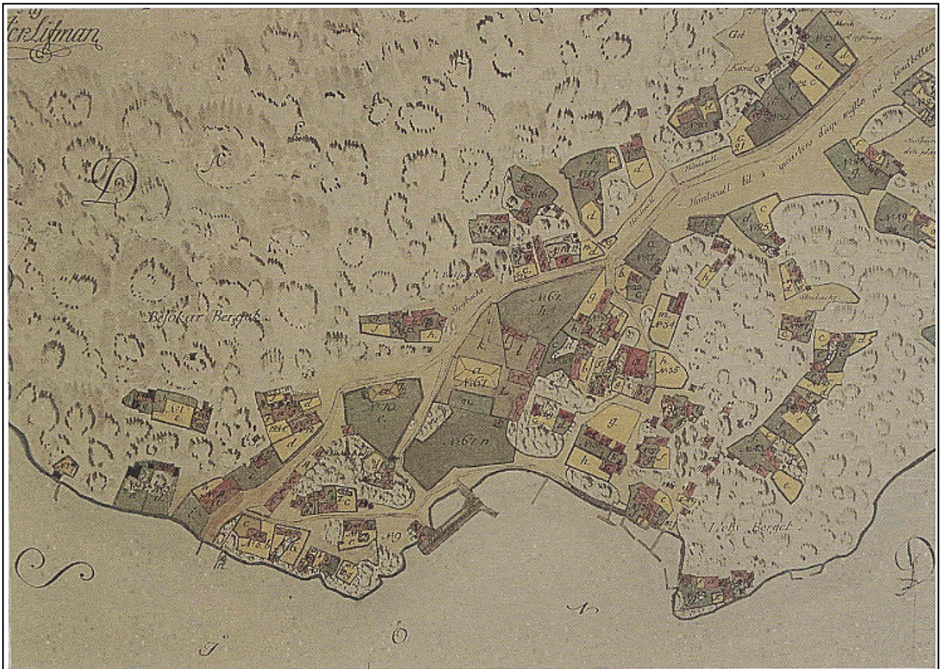
896 Karta Tullmuseet 1796

1796 års karta över Dalarö av Jeremias Lifman. Foto efter original i LMV:s arkiv. Bebyggelsen har ökat och blivit tätare. Tulltomten med det nyuppförda tullhuset (nummer 67) intar en framskjuten plats såväl på kartan som i verkligheten. Läggs märke till att det centrala Dalarö flankeras av Lotsberget och Besökarberget. Besökare var en titel på dåtidens tullbevakare/visitatör. (Jfr engelskans visit = besöka.) Idag är berget omdöpt till Amerikaberget.