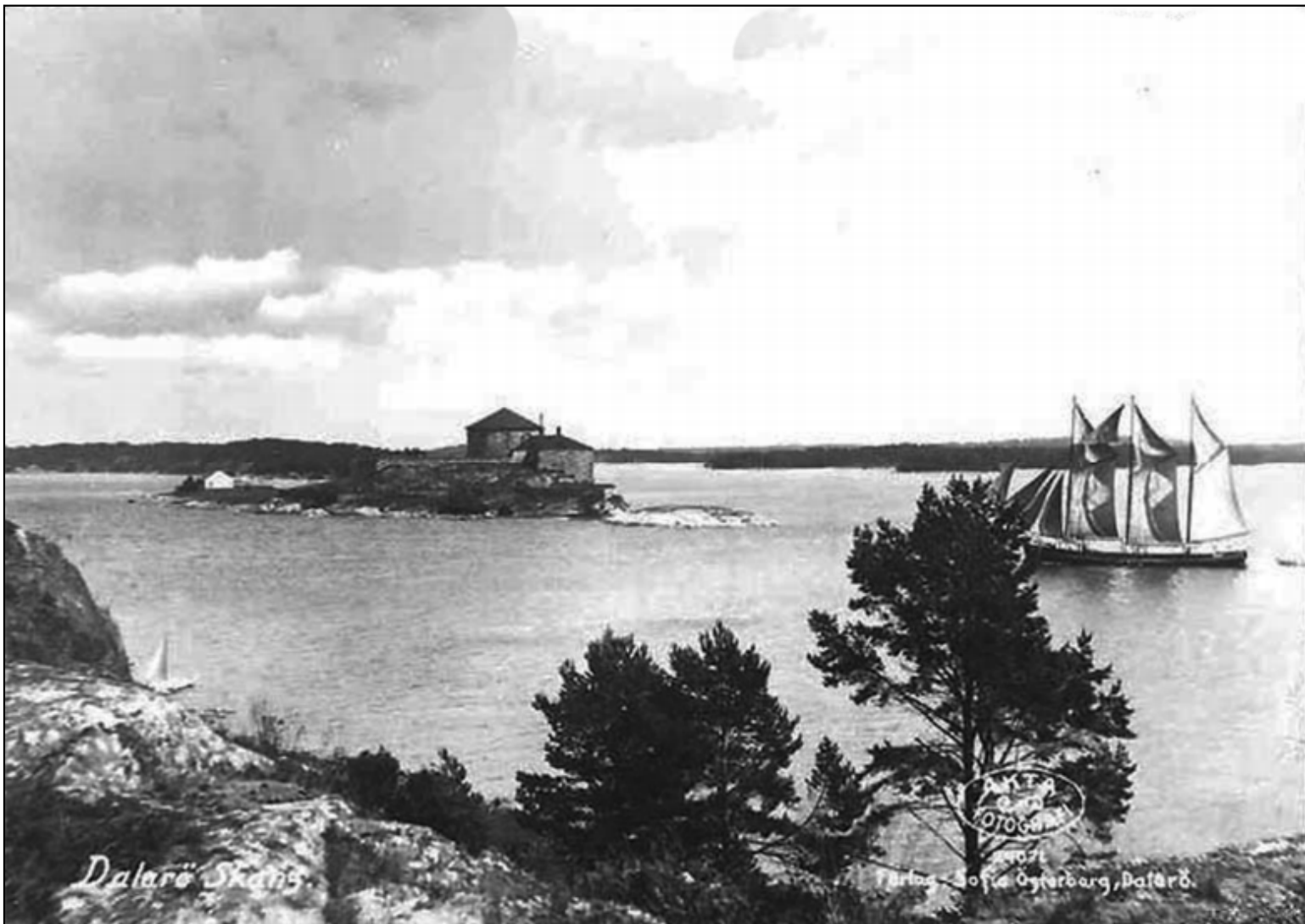
Dalarö skans sedd från grannön Kycklingarna.

Pesten drabbade de sjuka på olika sätt. Vissa somnade in helt stillsamt och dog utan att ge ett ljud ifrån sig. Andra kände »oavbrutet olidliga plågor», och »yrade och rasade in till sitt yttersta». En del klagade högljutt över sitt öde, och undrade varför Gud vänt sig ifrån dem. Samtidigt kunde hos vissa passionerade religiösa känslor välla fram.