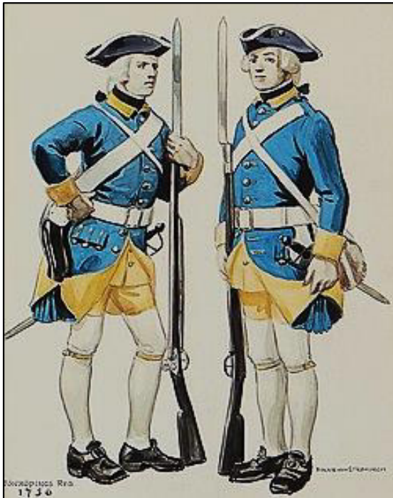
Svenska soldater vid tiden för Pommerska krigets utbrott. Soldaterna är klädda i uniform m/1756.

Eller kanske deltog de vid Slaget vid Neuensund som var ett fältslag under pommerska kriget som stod mellan svenska och preussiska styrkor vid Neuesund den 18 september 1761. Den svenska styrkan leddes av Jacob Magnus Sprengtporten som lyckades besegra de preussiska styrkorna under befäl av Wilhelm Sebastian von Belling.