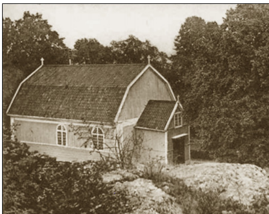
Dalarö kyrka, 1939.