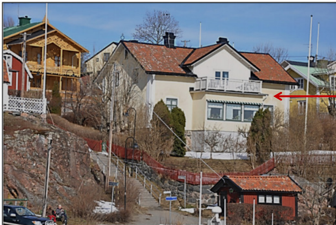
Nuvarande prästgården 2011. Nedre Tegnérsvägen 2.