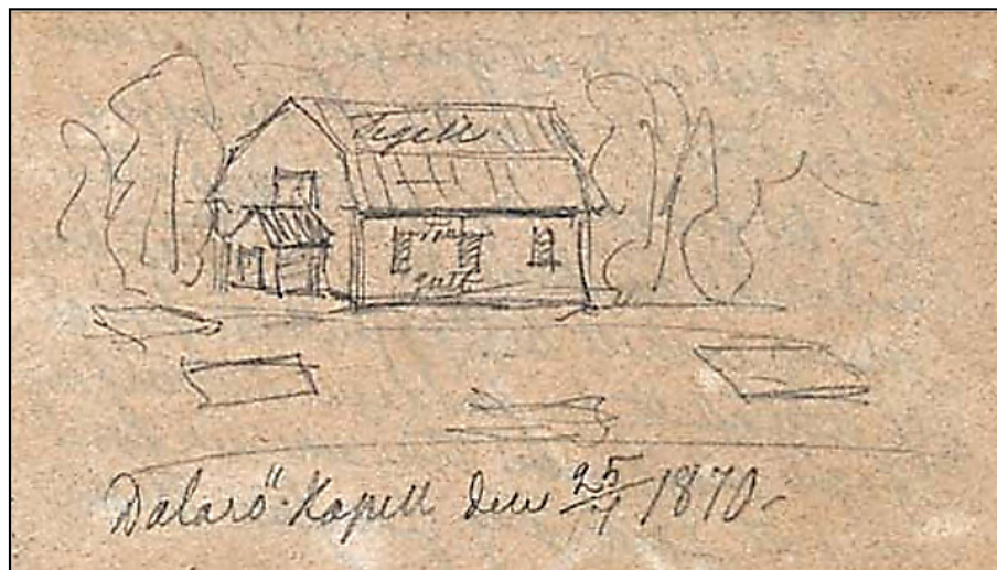
Dalarö Kapell 1870, okänd konstnär.

Innan ombyggnaden var det ett rektangulärt knuttimrat kapell med sadeltak och sakristia i norr byggt vid 1600-talets mitt.