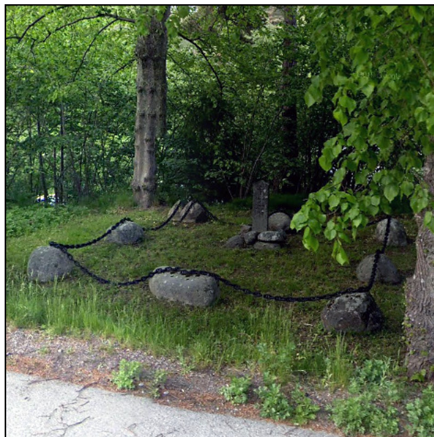
Här är staketet ersatt med kättingar.

Kolerakyrkogården benämns ibland felaktigt pestkyrkogård. Pesten på Dalarö tog 136 personer år 1710. Den ytttrade sig då som böldpest eller lungpest och bakterien spreds ofta med råttor.