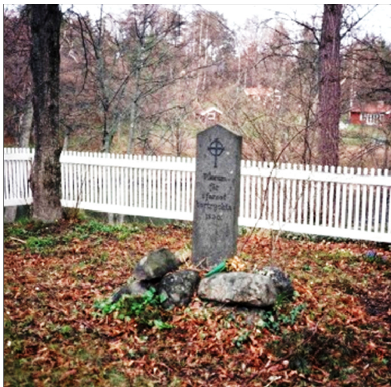
Äldre foto taget då det vitmålat trästaketet fanns kvar. Staketet åldrades med åren och kunde inte bevaras.

Det förfallna trästaketet ersattes då med en järnkätting fäst i åtta stora stenar.