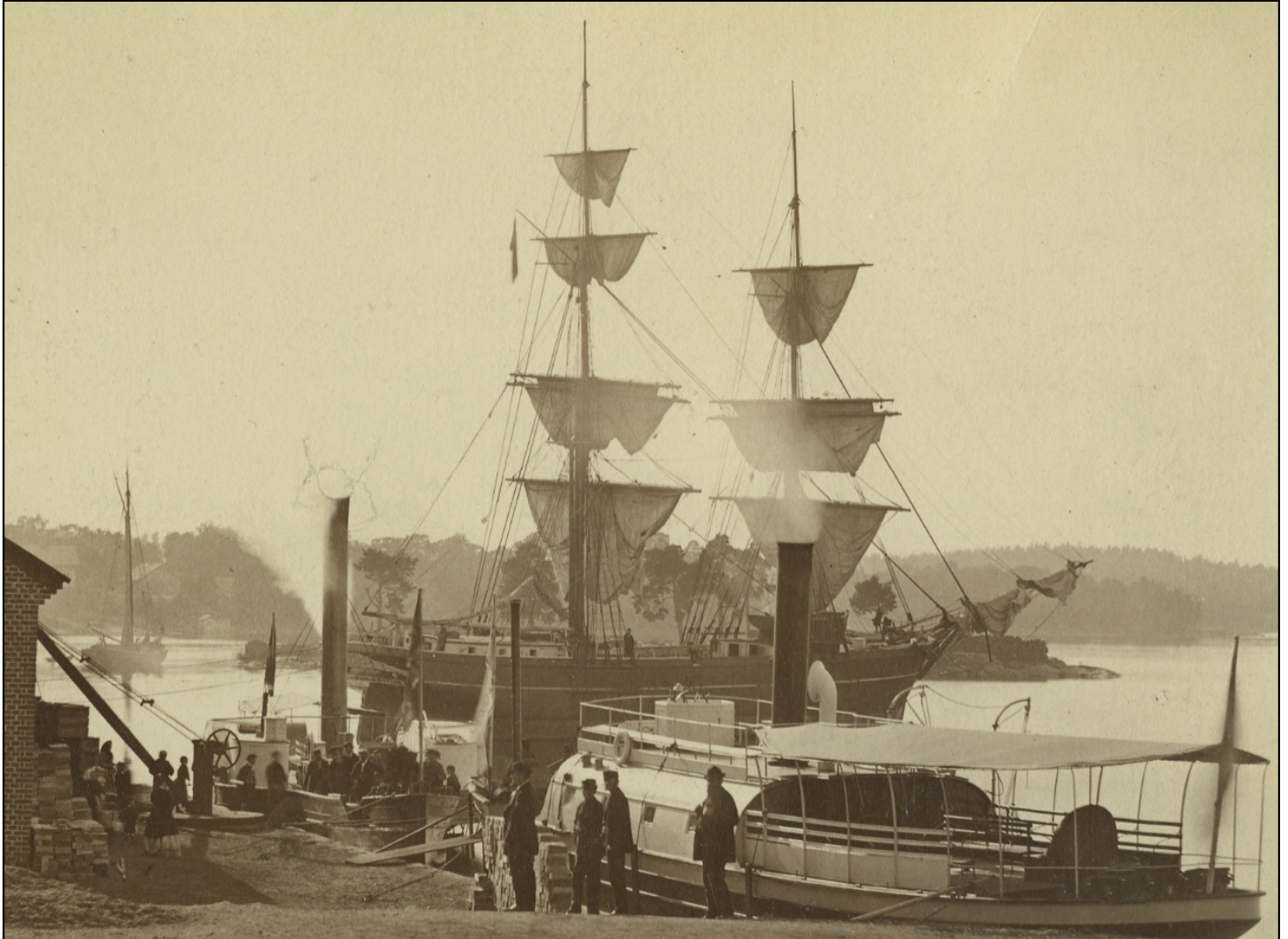
Hjulångaren Wermdö och skonare vid lastuskajen, Gustavsbergs hamn, 1873.