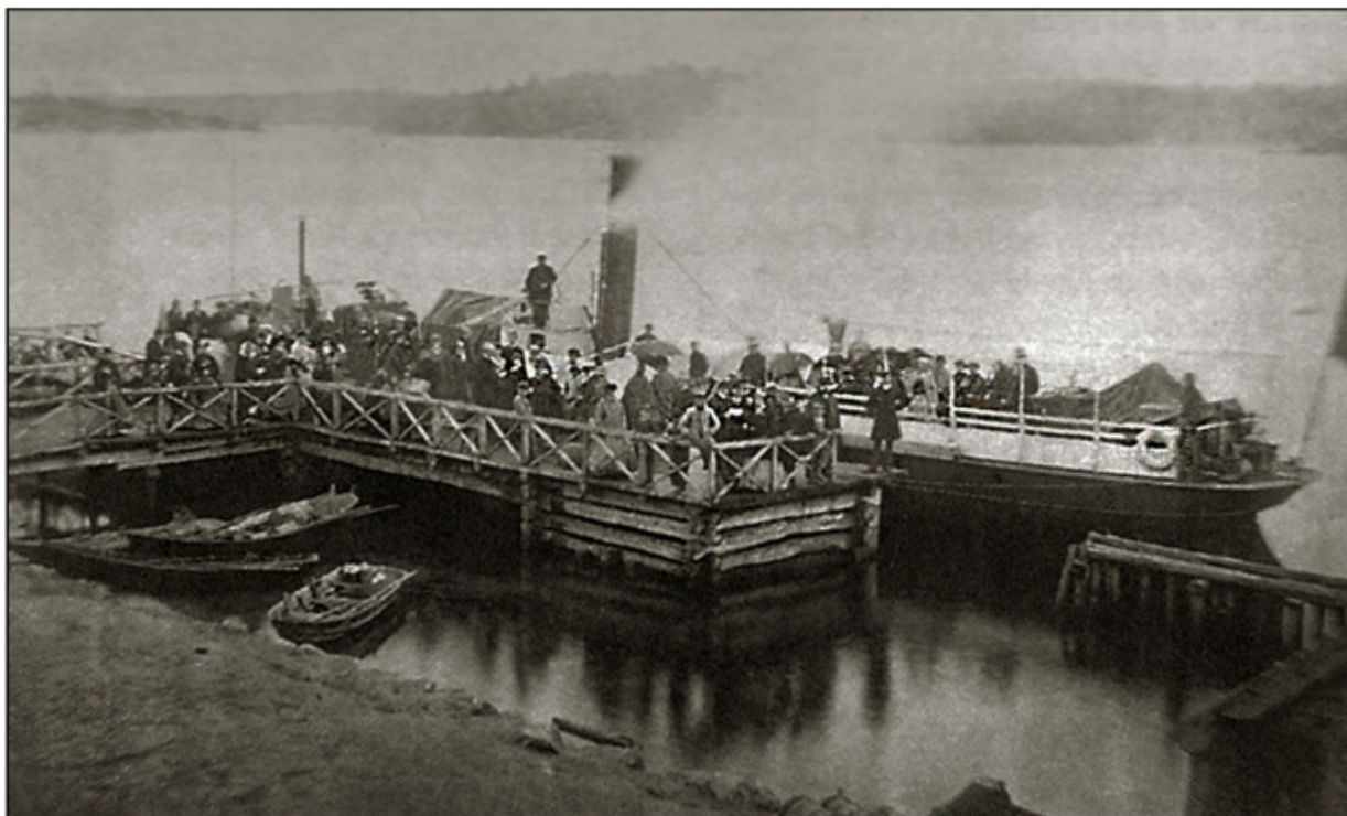
Hjulångaren Jacob Bagge vid Hotellbryggan på Dalarö.

August Strindberg anlände första gången 1871 till Dalarö med hjulångaren Jacob Bagge till ångbåtsbryggan (Hotellbryggan) för vidare transport till Kymmendö.