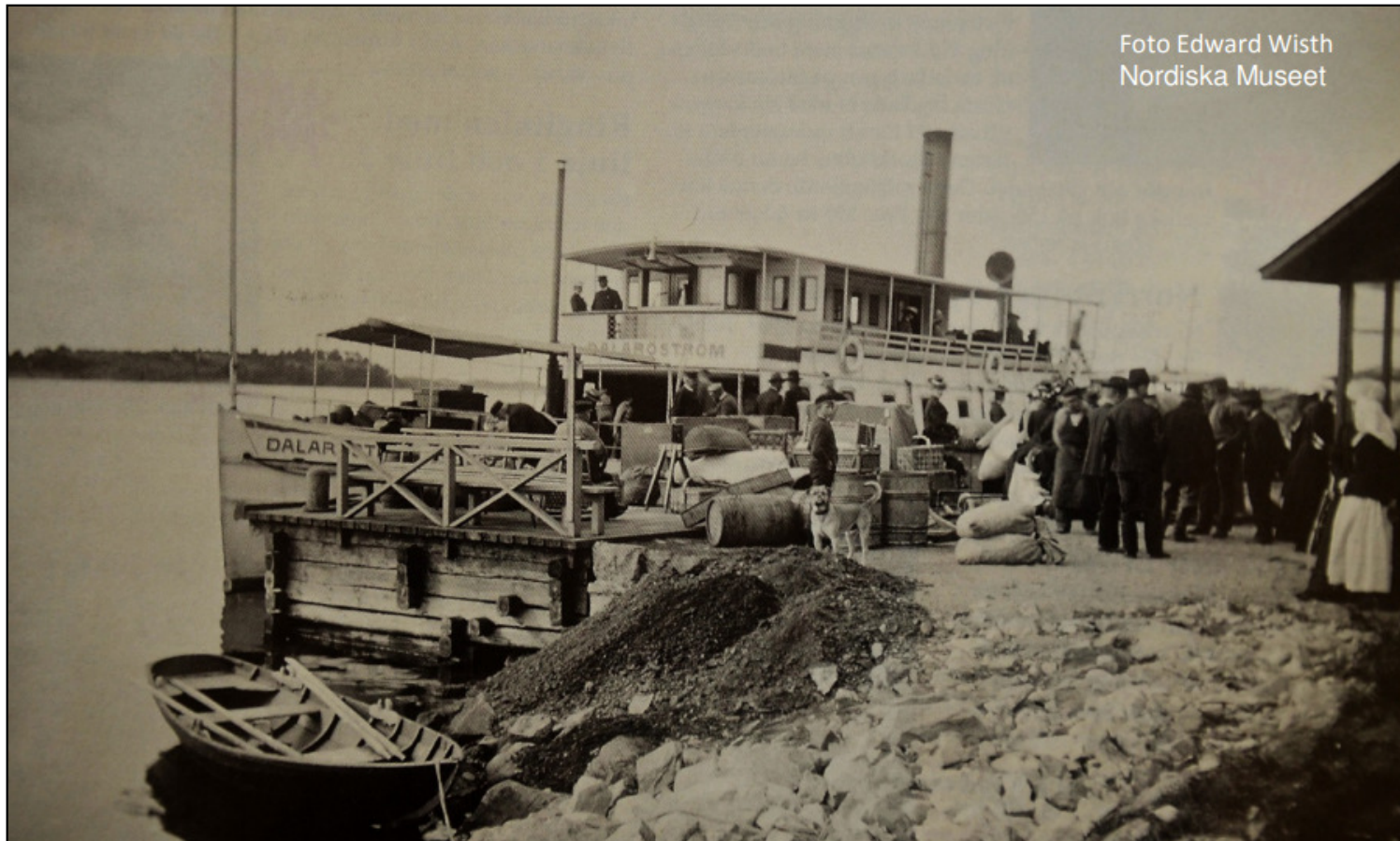
Dalaröström vid Hotellbryggan på Dalarö, 1902.

Dalaröström byggdes vid Bergsunds Mekaniska Verkstad 1876 till Ångbåtsbolaget Nya Dalarö. Hon trafikerade traden Stockholm - Dalarö från 1876 fram till början av 1900-talet, därefter blev hon insatt på andra destinationer. 1914 döptes hon om till Dalarö och 1926 till Västan. Hon såldes 1941 för skrotning.