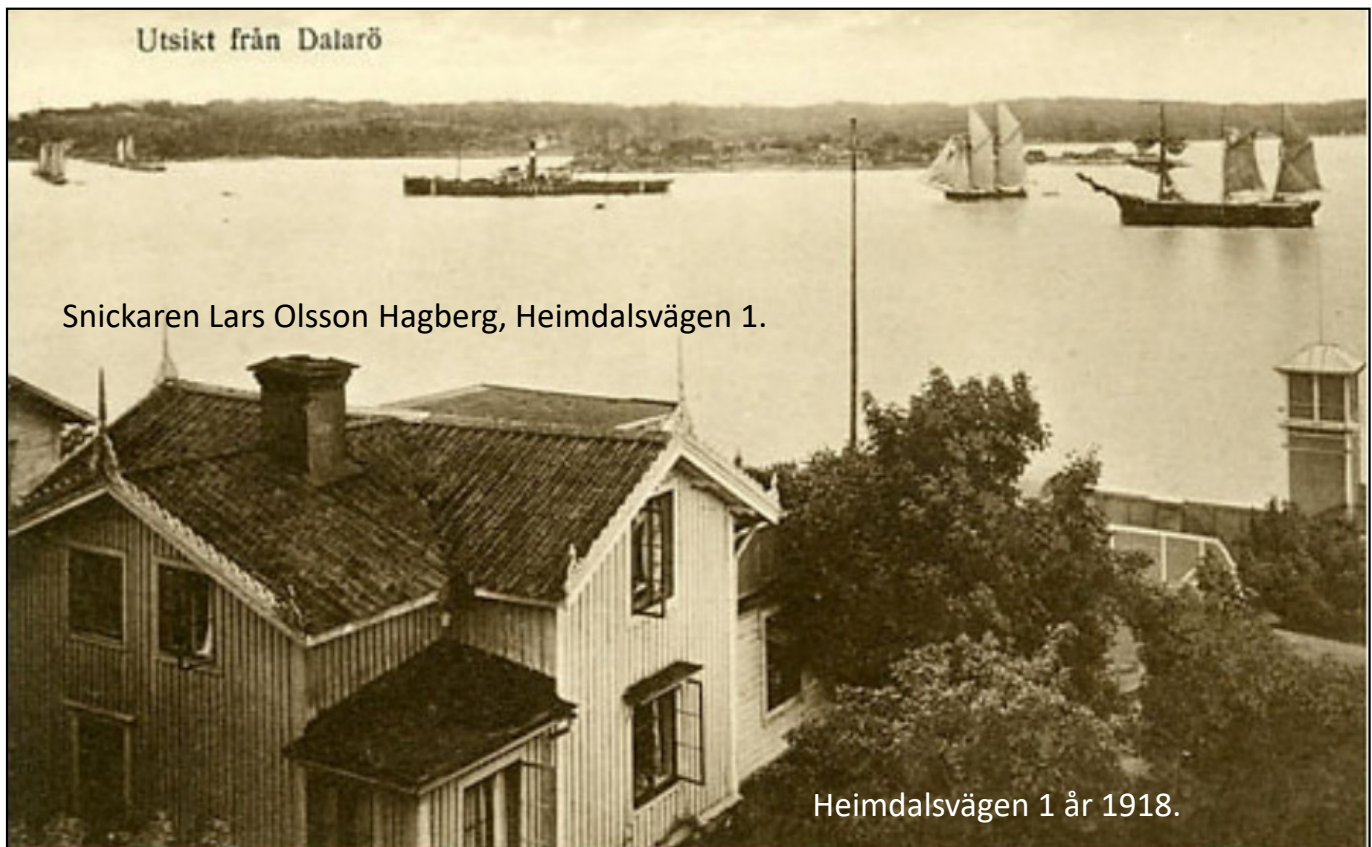
Utsikt från Dalarö