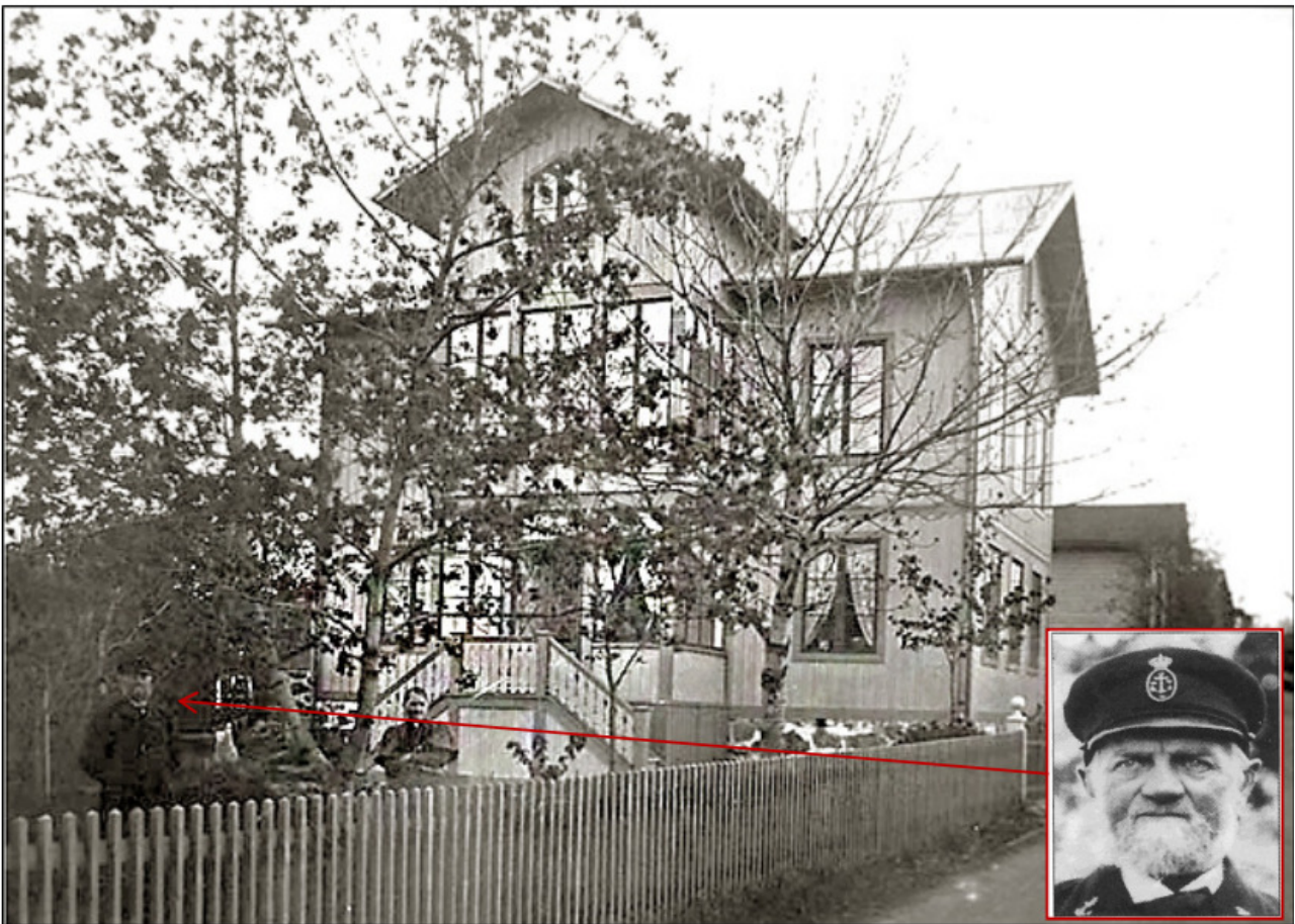
Lotsen Engels villa, okänt år.

På tullvaktmästare Sjögrens tomt nr 84, fanns ett boningshus om 2 rum och kök, en vedbod och en matbod. Tre av Sjögrens sommarboende badgäster förlorade lösegendom och matvaror till ett betydande belopp.