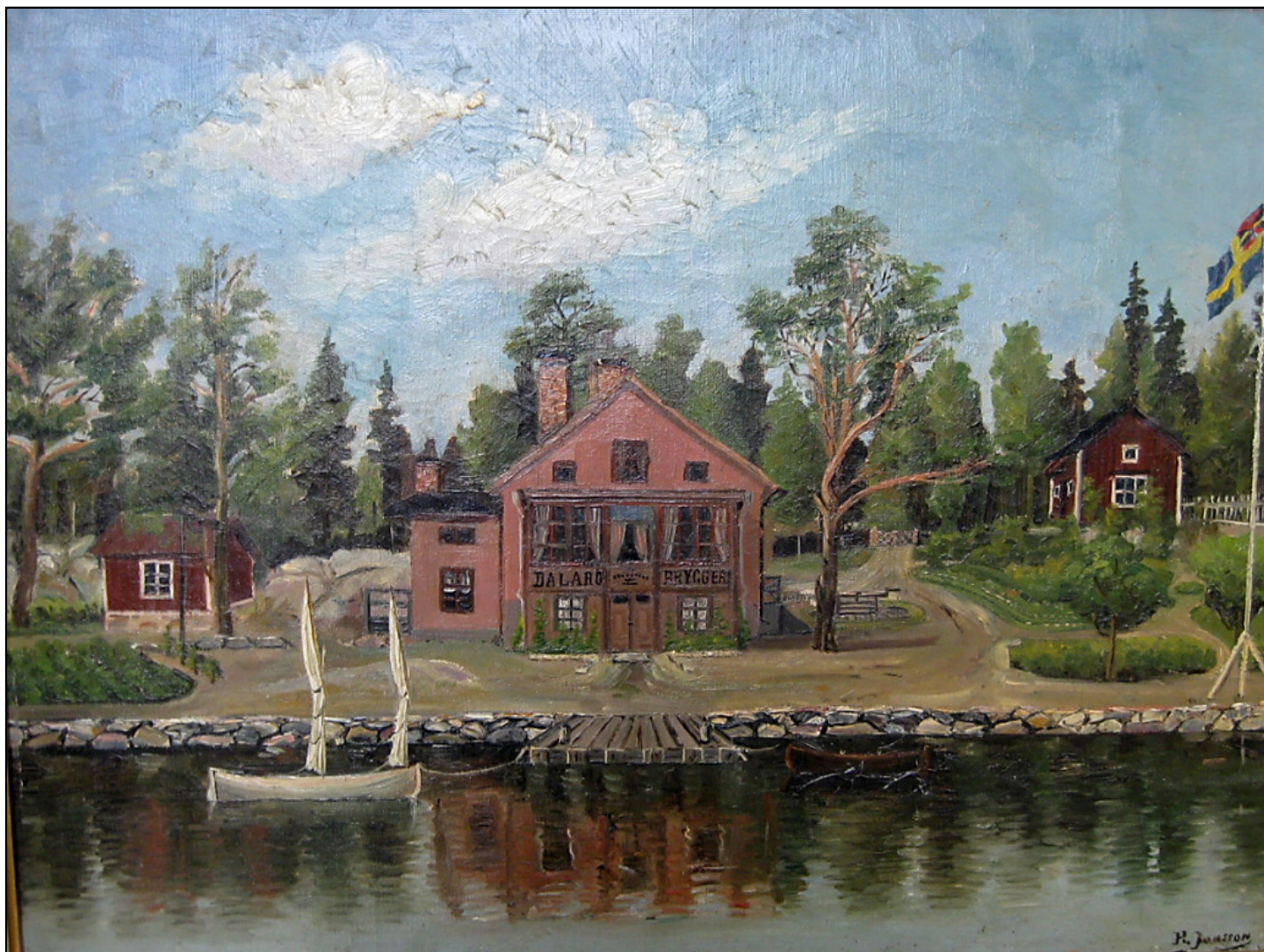
Bryggeriet målat av H. Jonsson 1890.

Se DHF:s redogörelse SC137: Bryggeriet på Smådalarö.