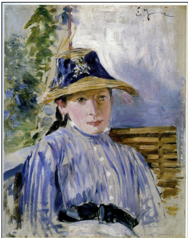
"Flicka i blått", 1883, olja på pannå, 33 x 26 cm Nationalmuseum.

Ernst Josephson vistades fyra somrar från 1883 på Dalarö, troligtvis bodde han då hos sina systrar på Smådalarö.