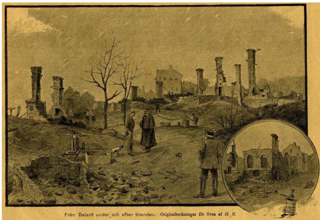
Från Dalarö under och efter branden. Originalteckningar för Svea af H. R.

Vy från Hotellbryggan och Odinsvägen över brandområdet bort mot Tullbryggan. I förgrunden t.v. syns möbler och del av inredningen från Hultmans hotell.