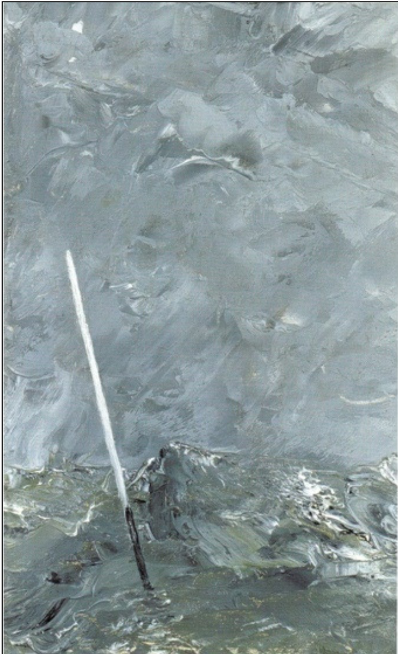
"Slätprick", 1892, olja på duk, 31 x 19 cm, Nationalmuseum Stockholm.