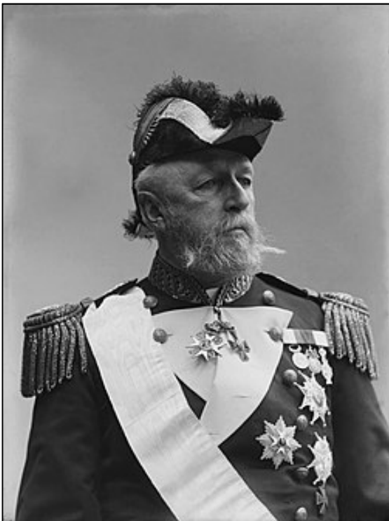
Oscar II, Oscar Fredrik , f. 1829 d. 1907 på Stockholms slott, var kung av Sverige 1872-1907, kung av Norge 1872–1905, samt hertig av Östergötland.

De befolkades till lika delar av Stockholms skönt klingande societet och av dess judiska patricier som också var tillräckligt kontinentala för att söka vad man kallade Sommerfrische i skärgården. Medan den ena kategorien hugnades med besök av kung Oscar på Drott resulterande i illuminerade festiviteter gästades den andra av allsköns skriftställare och målarbohemer, vilka befäst Dalarös ställning i den svenska kulturhistorien.