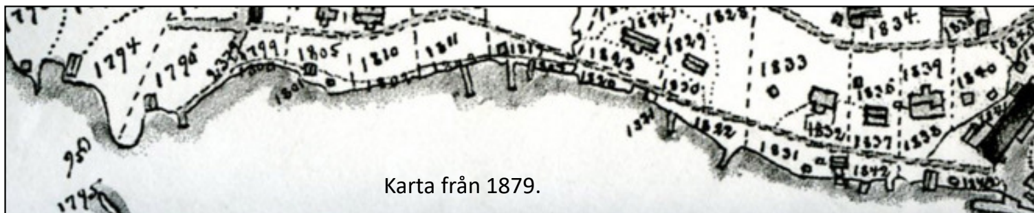
Karta från 1879.

Namnet upphävdes år 1989 och samtidigt namnändrades vägen till Dalarö Strandväg. Den östra delen kom samtidigt att ingå i Tullbacken.