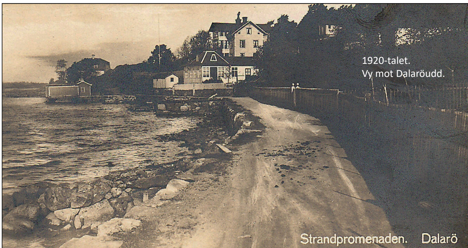
1920-talet. Vy mot Dalaröudd.