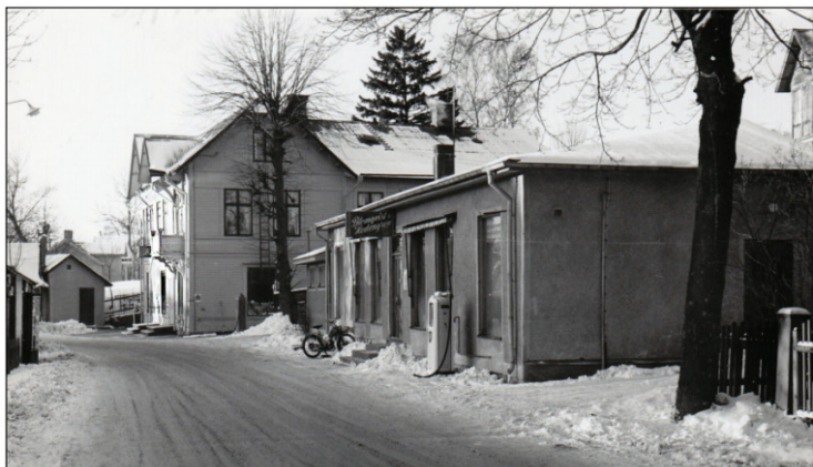
Dalarö Snabbköp 1965.