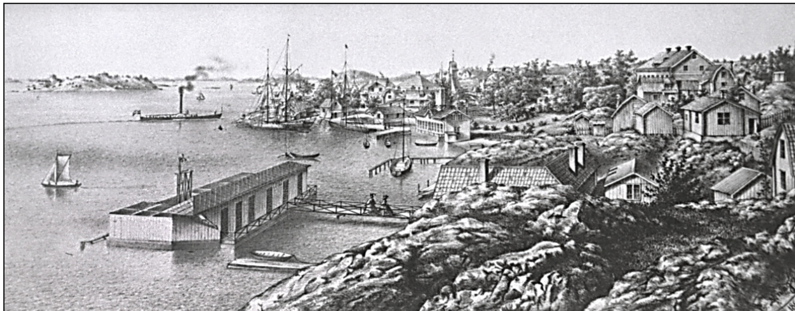
Teckning gjord av Svante Hallbeck 1886.

Första kallbadhuset som låg i Fiskarhamnen rivs.