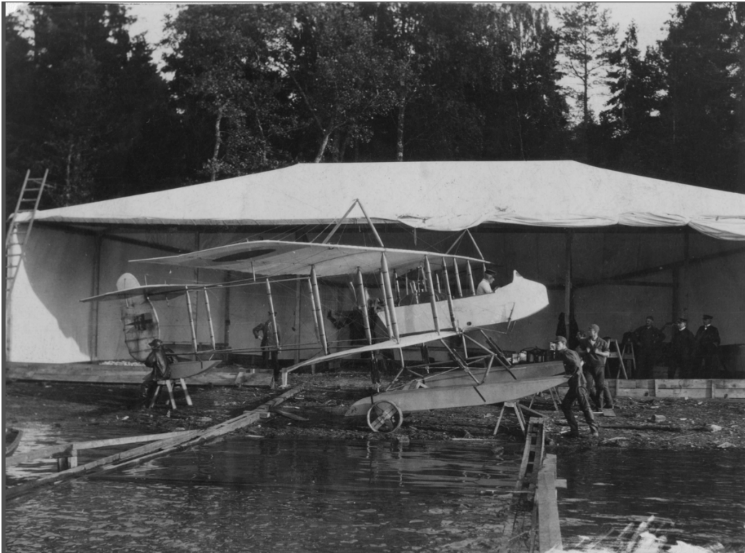
Spaningsflygplanet Farman HF 23 med flottörer på vattnet framför tälthangaren vid Askfatshamnen.

Bland de första kunderna märktes Anders Zorn som köpte två av de södertäljebyggda Farmanplan för att skänka ett var till arméflyget respektive marinflyget.