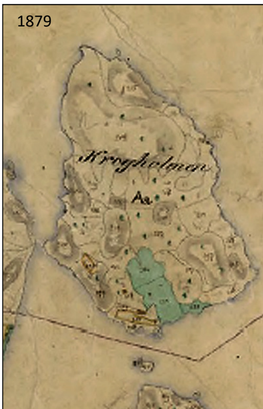
Krogarholmen / Krogarholmen.