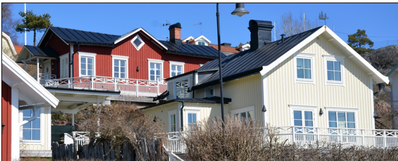
Dalarö Strandväg nr 13 och 15 år 2014.

Dalarö kommun sålde fastigheten Dalarö Strandväg 13, till sjökaptenen, mästerlotsen och konstnären Oscar Fagerlind, Dalarö. Fastigheten Dalarö Strandväg 15 såldes till lotsen, Karl-Ivar Eriksson.