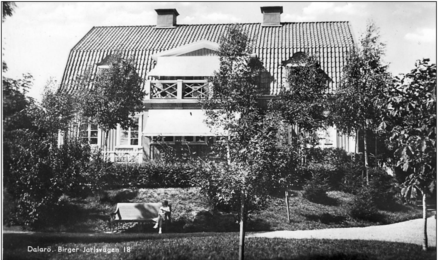
Stockenbergs / Solhöjden.

Mer om de olika pensionaten finns att läsa om i DHF:s olika redovisningar bl. a. SC171 till SC189.