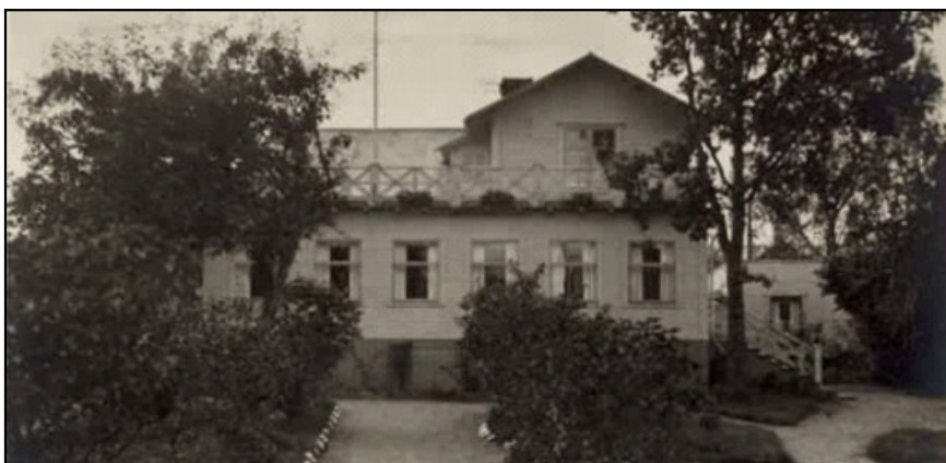
Tykö / Lilla sällskapet.

På Dalarö fanns många pensionat vilket framgår av olika tidningsannonser runt sekelskiftet 1900.