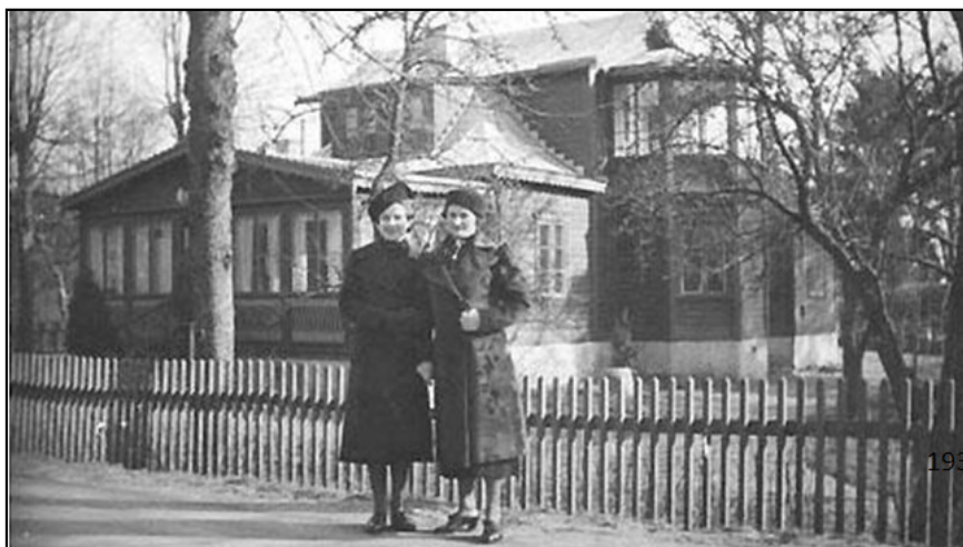
Kina / Lilla Kina.