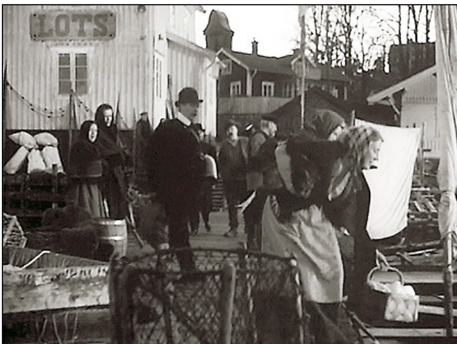
Scenen då ”Karlsson” är på bryggan för att stiga ombord i skötekan.