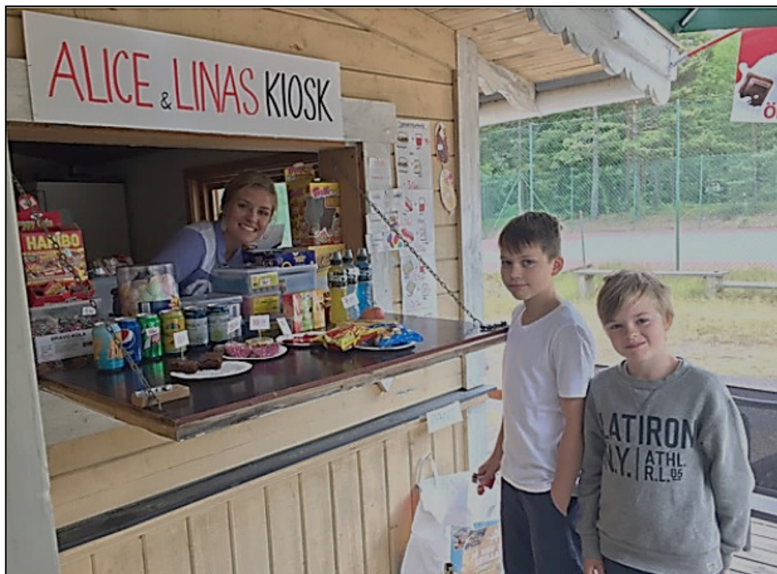
Tennisbanorna och sommarkiosken vid Vadviken, 2020.