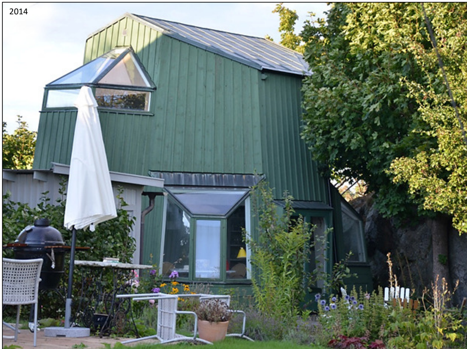
Vy från gårdssidan.