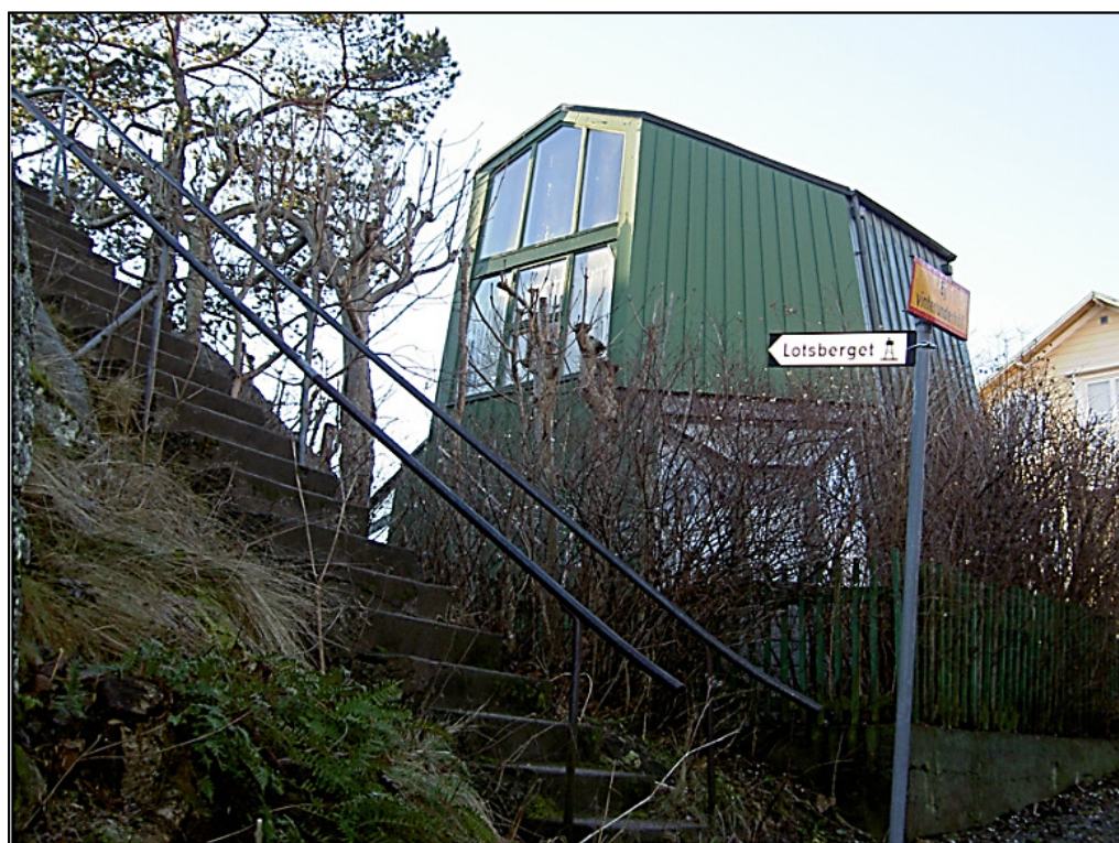
Trappan upp till Lotsberget.