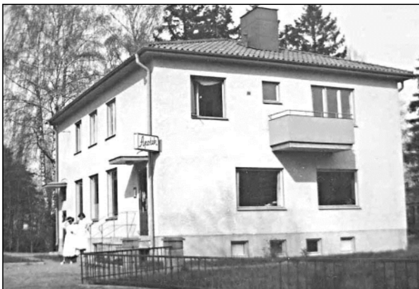
Apoteket med adress Odinsvägen 26 som stängdes i september 1981.