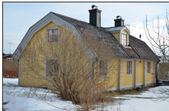
Birger Jarlsvägen 22. Se DHF:s redovisning SC118.