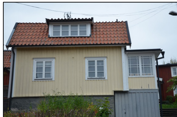
Dvärgbacken 1B. Se DHF:s redovisning SC111.