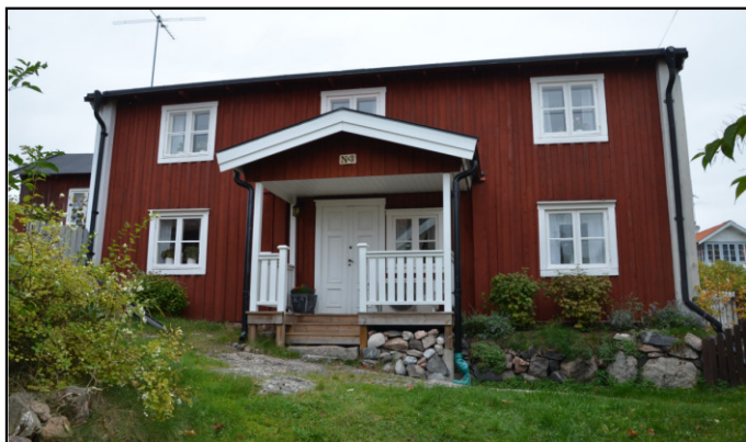
Dvärgbacken 3. Se DHF:s redovisning SC112.