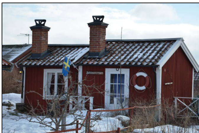
Birger Jarlsvägen 24. Se DHF:s redovisning SC109.