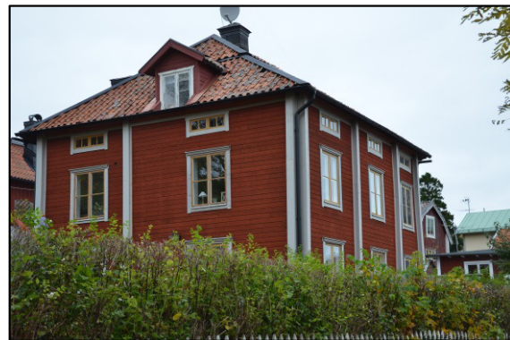
Dvärgbacken 1. Se DHF:s redovisning SC110.