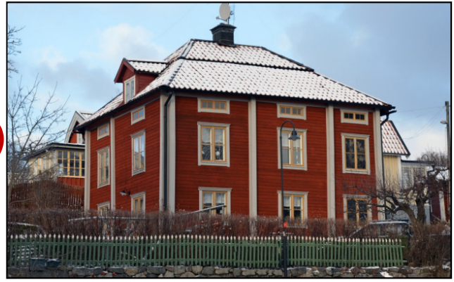
Första postkontoret som öppnade 1770.