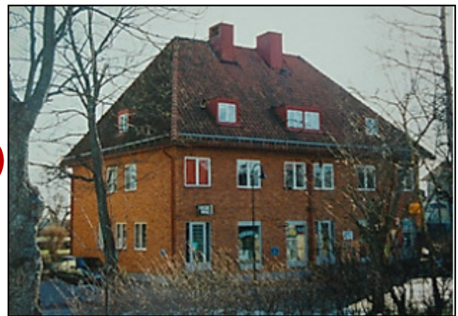
Odinsvägen 18, Tegelhuset, 1944-1967.