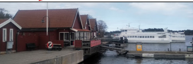
Dalarö Skärgårdsservice vid Hotellbryggan år 2020.