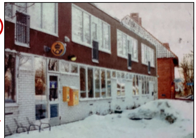
Odinsvägen 20, 1967-1998.