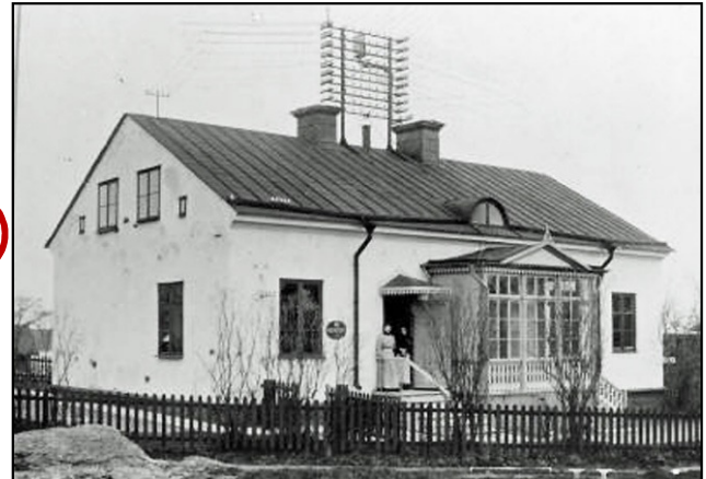
Postvägen 3, slutet 1893-1944, där telegrafstationen fanns kvar till 1952.