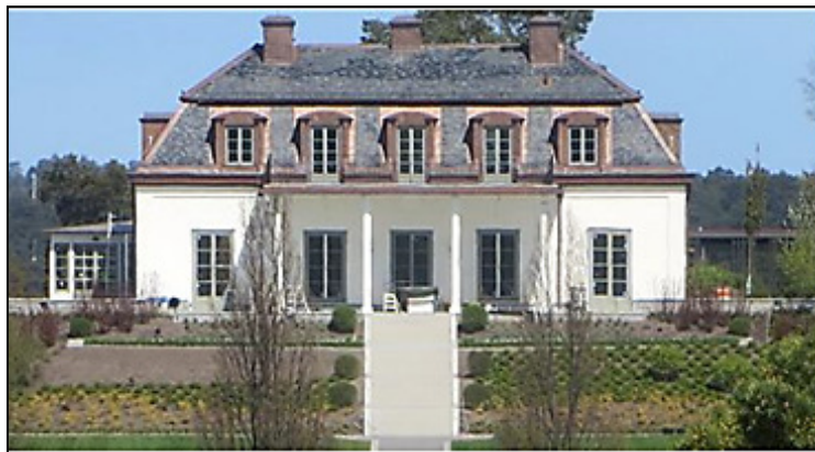
Huvudbyggnaden år 2005 resp. 2016.