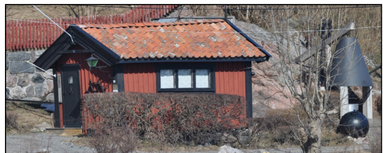
Anders Franzéns Museum 2011.