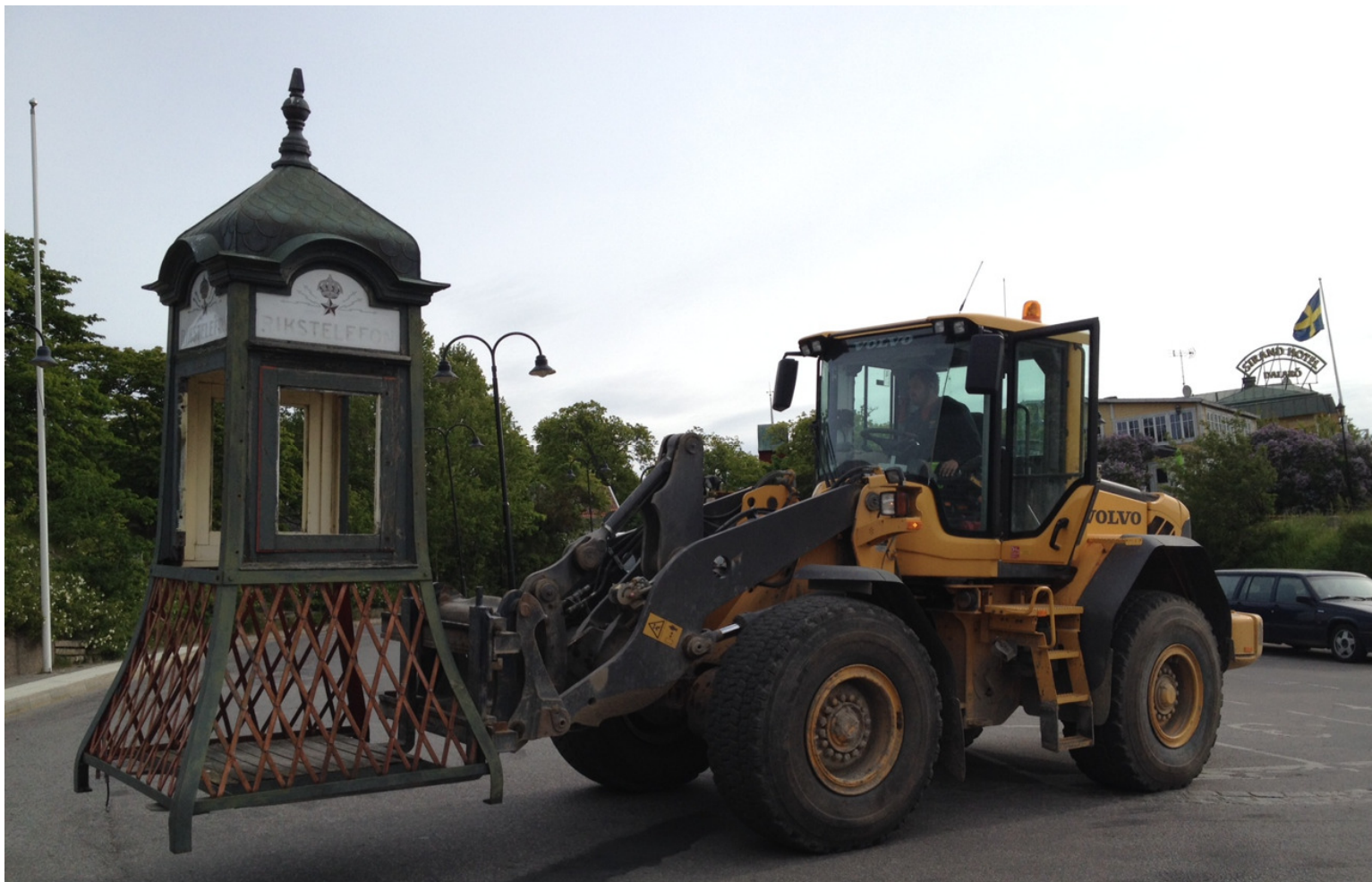
Pagoden flyttas från Hotellbryggan till Roland Palms Land & Sjösnickerier AB på Sveavägen.

Renoveringsarbetet utfördes till största delen som ideellt arbete av Roland Palms Land & Sjösnickerier AB. Hela mellandelen mellan gallret och taket måste tillverkas enligt gamla ritningar och nya glas köpas in.