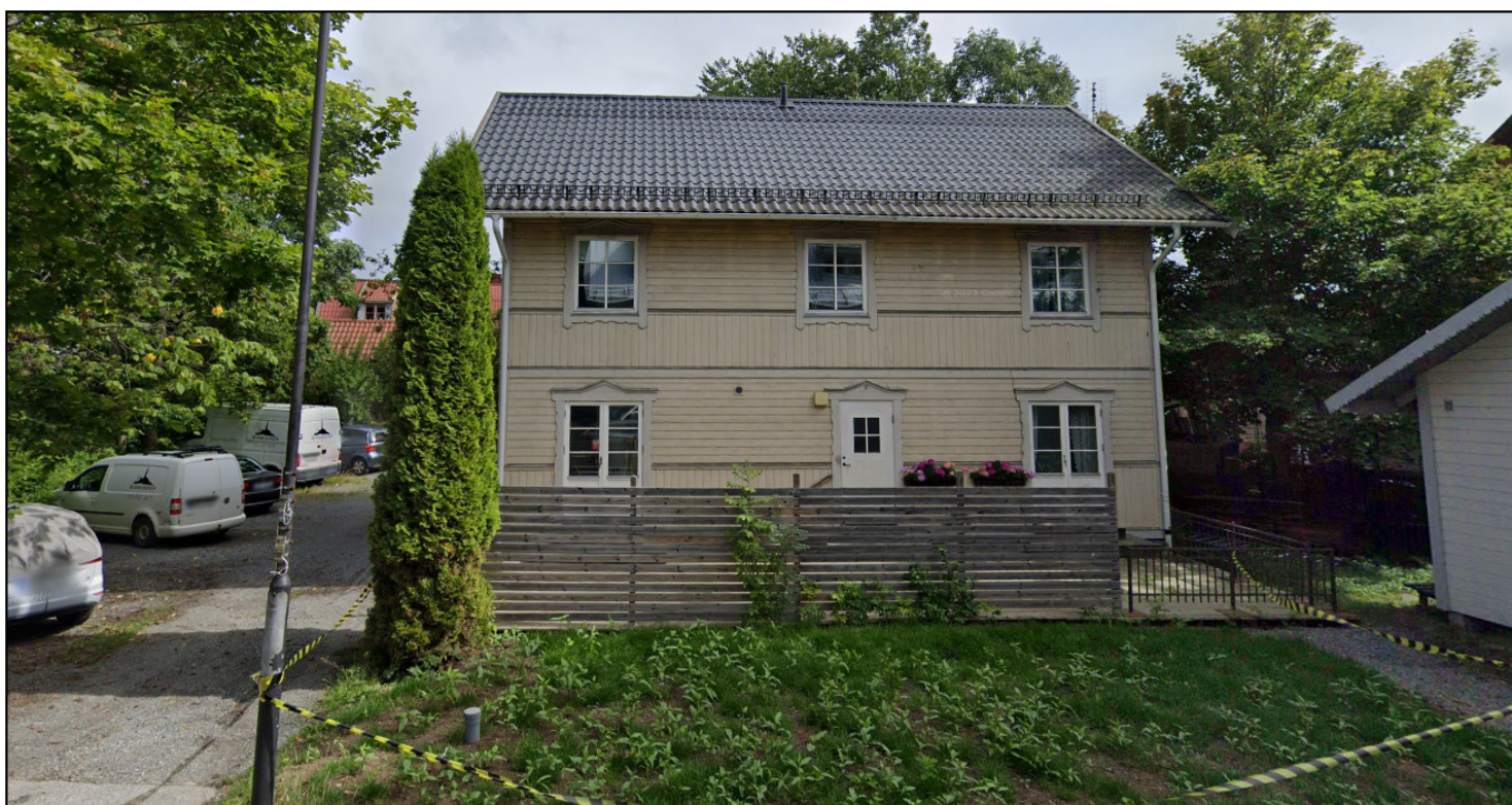
Huset Odinsvägen 12A, som nu skymmer det bakomliggande nr 12B.

Huvudbyggnaden är en rektangulär timrad länga under ryggåsförsett brutet tak, täckt med enkupigt tegel. Byggnaden har nockbräda, kantbräda och vindskiva samt ett par sidoåsar förutom huvudåsen. I väster finns tre pulpettaksförsedda vindskupor med fyrdelade fönster. Vidare finns i väster en envånings glasveranda med ingång från gården genom en glasad döbattang. I öster har byggnaden ett envånings pulpettaksförsedd, på stolpar, vilande glasveranda. En trätrappa med kryssornerat räcke leder upp till den. Byggnadens fönster är i nedre botten av sexdelad typ. Endast söder finns insatt ett modernt fönster. I övrigt finns en väl bevarad kakelugn, rund, vit med blå ornament.