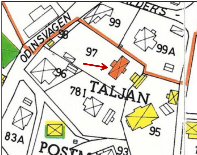
Karta från 1968.

Foto taget innan det byggdes ett hus framför detta hus mot Odinsvägen.