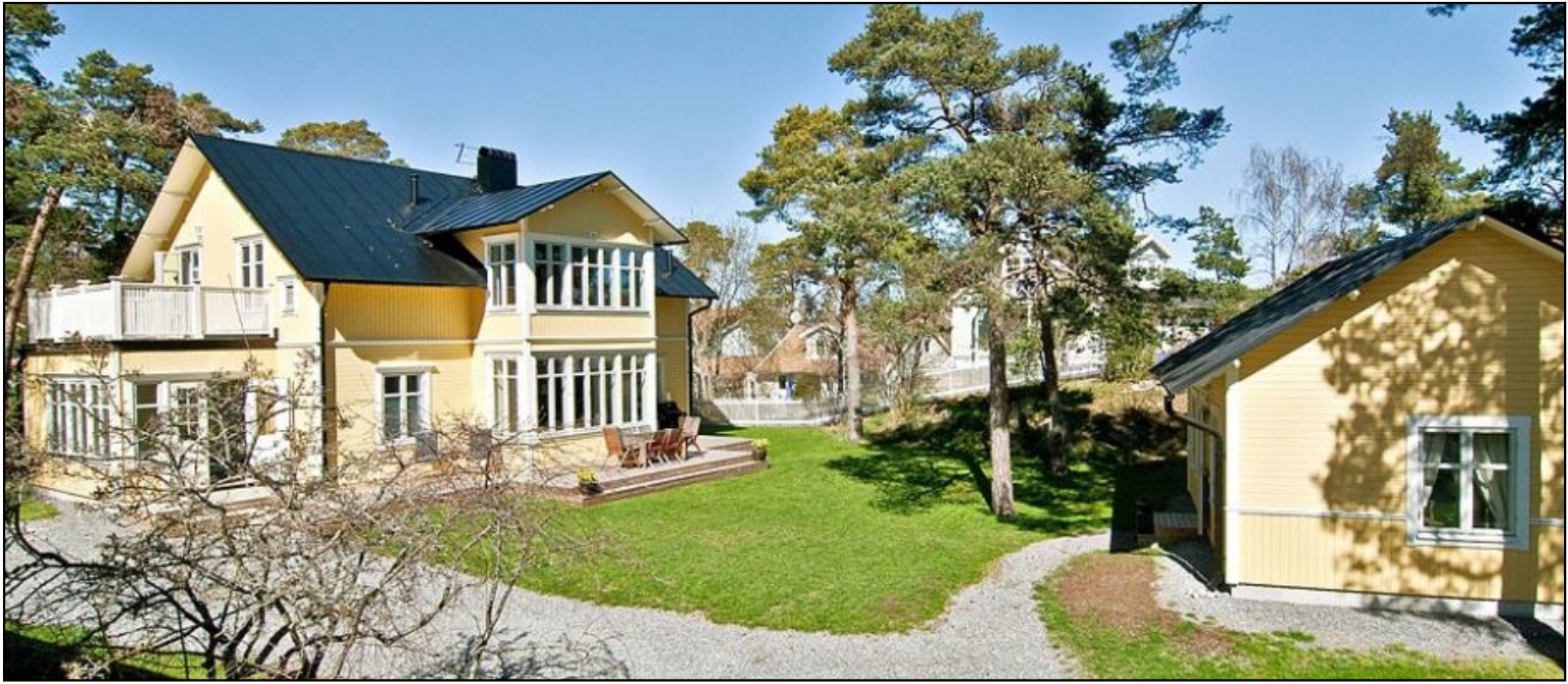
Huset som byggdes 2012 på samma plats, bilden är från försäljningen 2012.