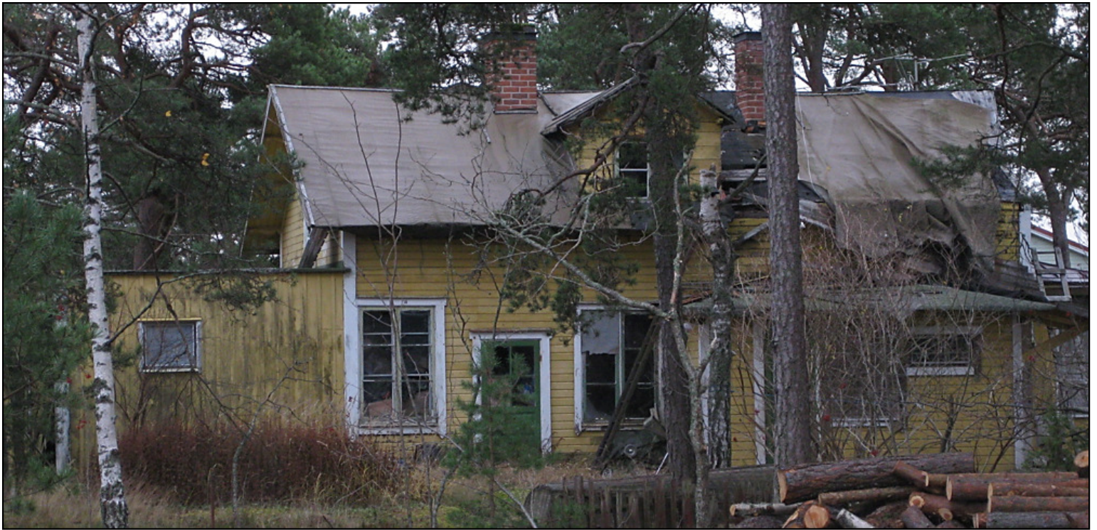
Huset som revs, bild från 2009.