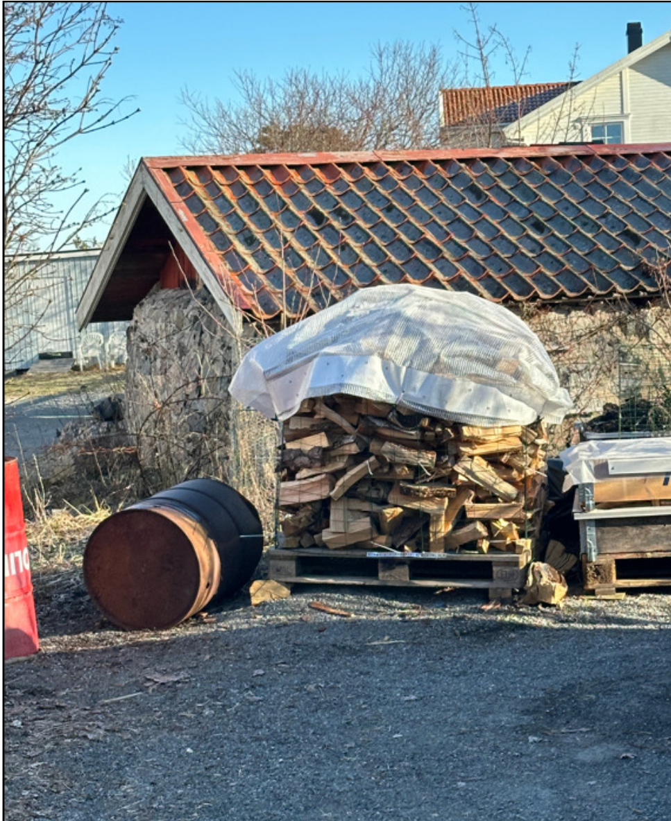
Bilder från 2024.