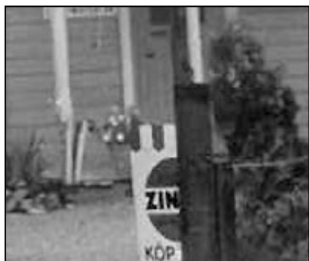
På skylten vid Wallinvägen 1968.