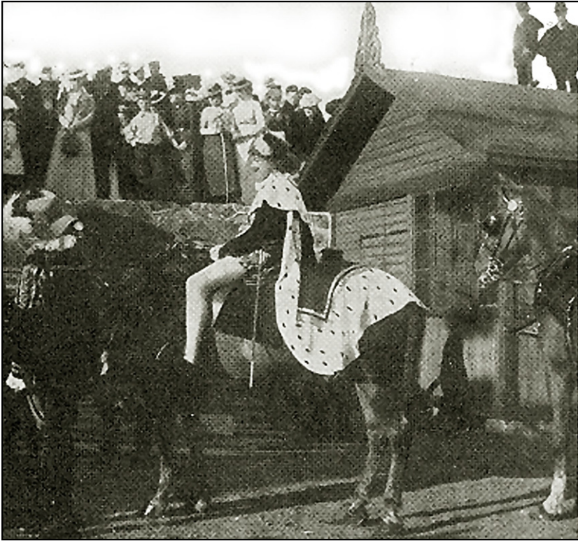
Prinsen av Dalarö gör sitt intåg.