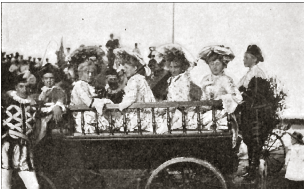
Riddarföljet, de som inte ville promenera till Schweizerdalen kunde få åka hästdragen vagn.

Ovanstående två bilder är tagna ur Conny Burmans bok "Från skvallerbänken".