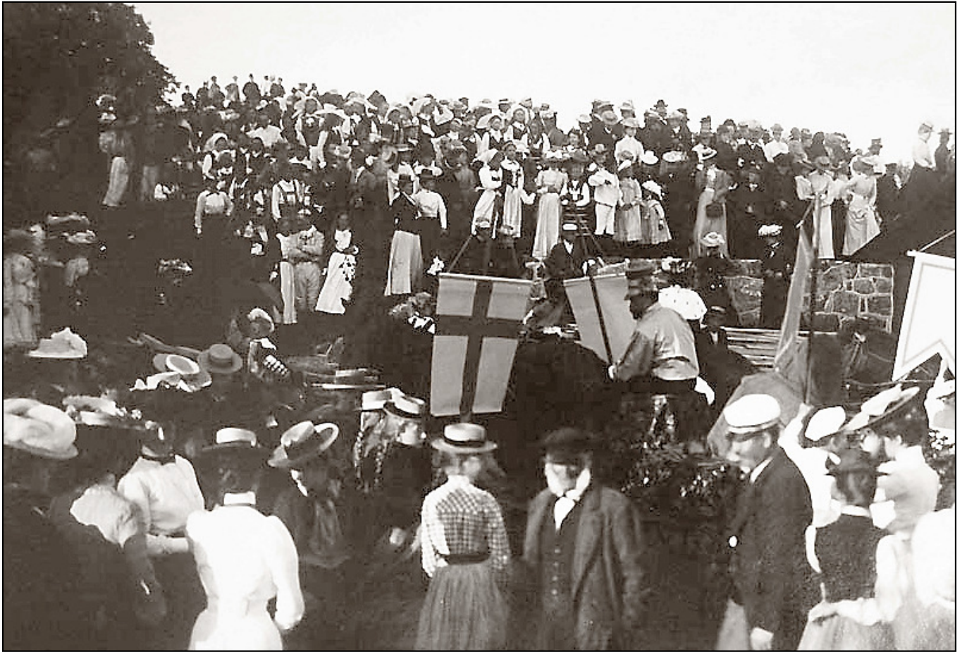
I väntan på Kung Sommars ankomst vid Hotellbryggan.