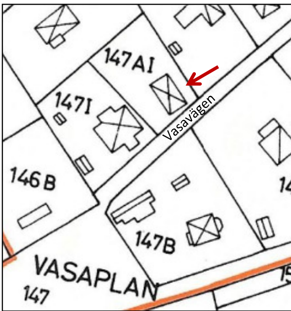
Karta från 1968.