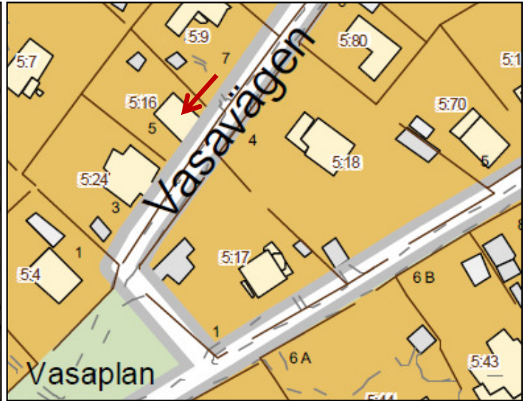
Karta från 2009.