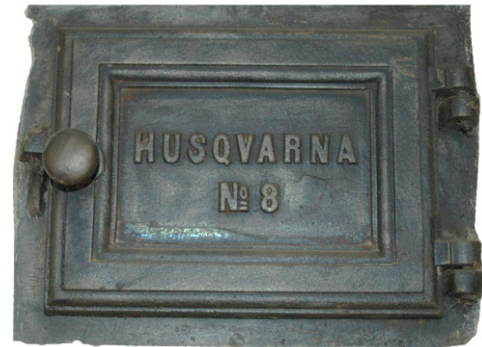
Några av ugnsluckorna som sitter på den stora bakugnen.