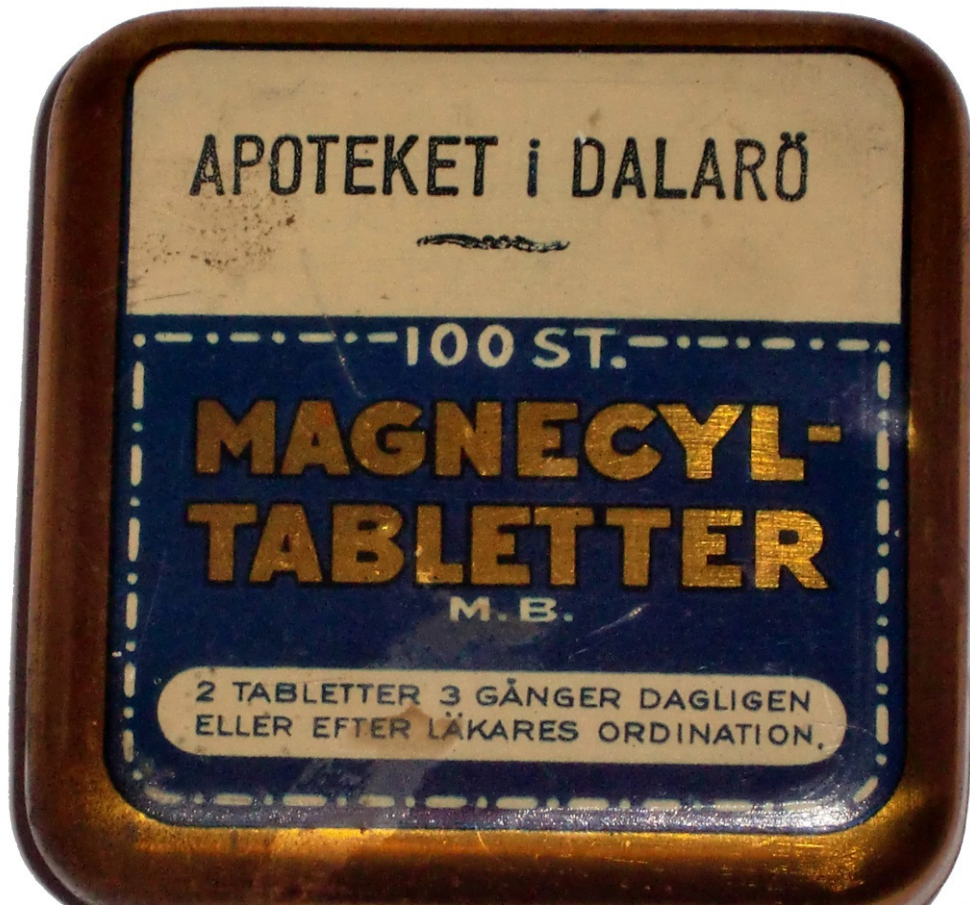
Plåtask med Magnecyltabletter.