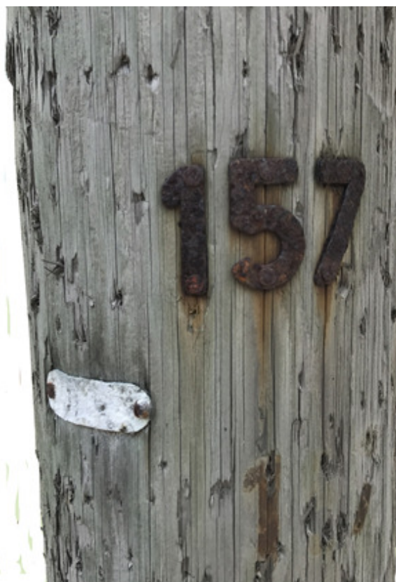
Dalrövägen vid avfarten till Tjursjön