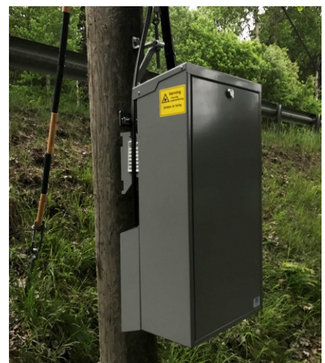
Stolpen benämnd som nr 157 är nu försedd med skåp för distribution av bredband, år 2017.