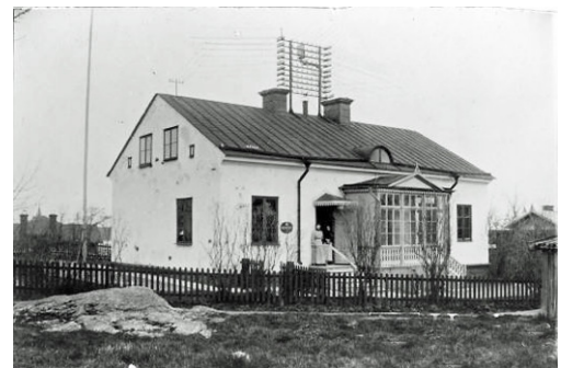
Telefon-/Telegrafstation låg vid början av 1900-talet på Postvägen 3