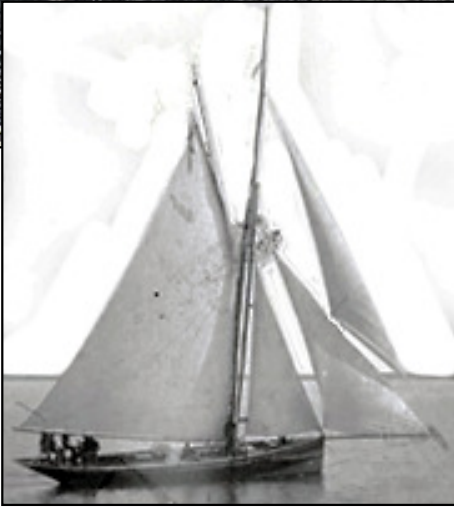
Kuttern Olwen som här lämnar Fiskarhamnen på Dalarö 1894.

Bild från Airisto Segelsällskap som 2019 firar 150 år och har denna bild av kuttern Olwen uppsatt på väggen i sin restaurant.