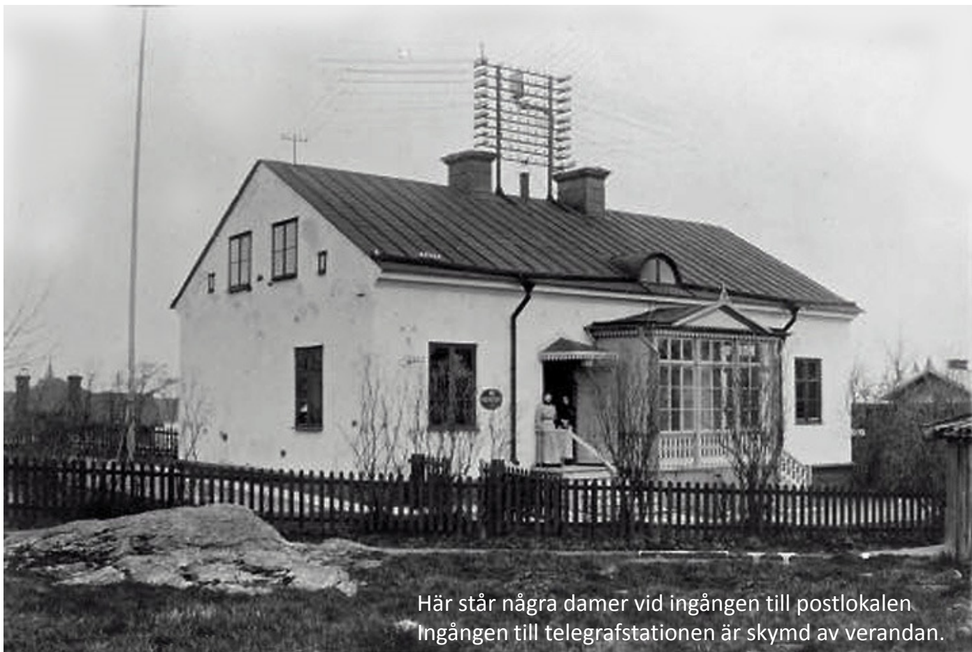
Här står några damer vid ingången till postlokalen Ingången till telegrafstationen är skymd av verandan.