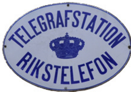
Emaljerat emblem som fortfarande finns på fasaden