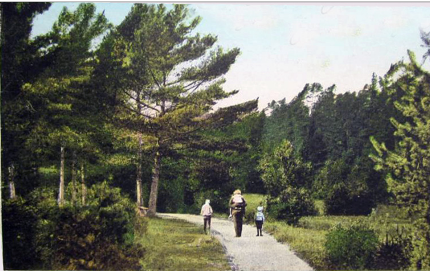
Väg till Schweizerdalen