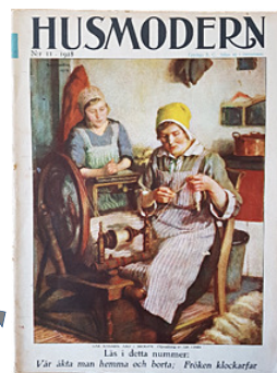
Husmodern nr 11 1928.