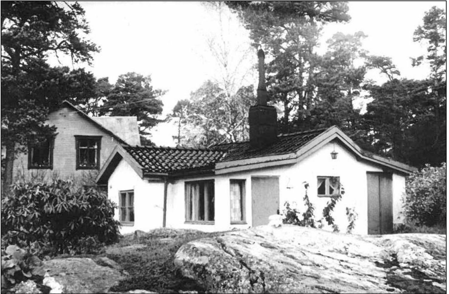
Bilder från 1968. I bakgrunden syn Mästerlotsens väg nr 15.