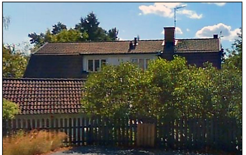
Det stora huset som nu finns på Mästerlotsens väg nr 13.

På nästa sida finns kartor och några fler bilder av det lilla huset.