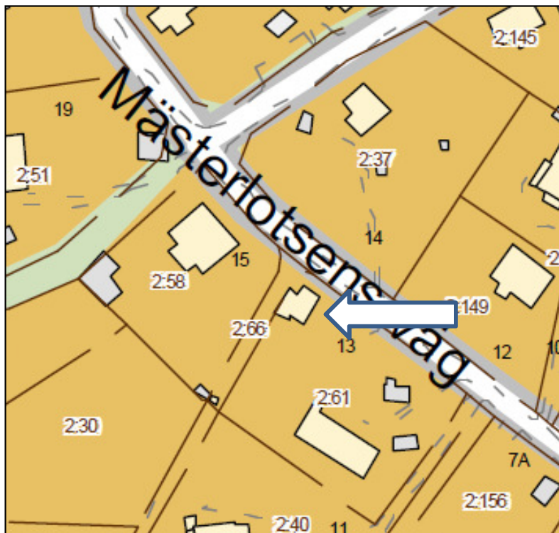
Karta från 2009.